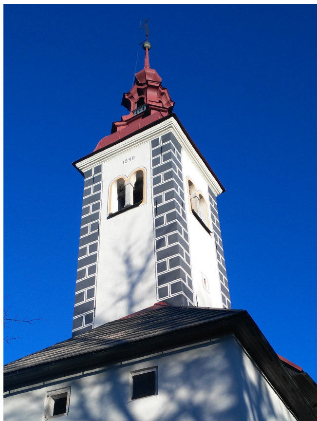
Cerkveni zvonik.