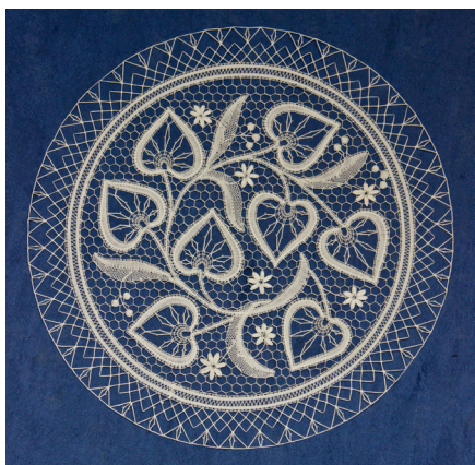
Slovenska lipa, vzorec narisala: Vida Kejžar, čipko naklekljala: Mara Ferle

dediščine počasi spreminjal na bolje. Klekljana čipka je postala eden od simbolov slovenske identitete.