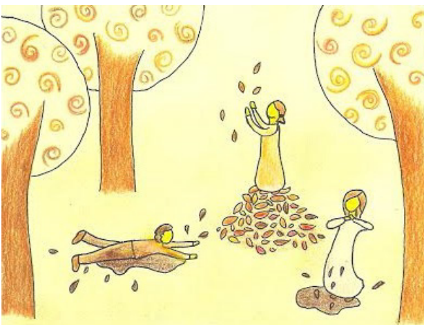
Poezijo je prispevala Katja Kožuh Ilustrirala: Tadeja Klobučar

Zaspati po krohotu zlitega kakava na rumenem prtu. Zaspati in sanjati naključne sanje sanjskega kanala.