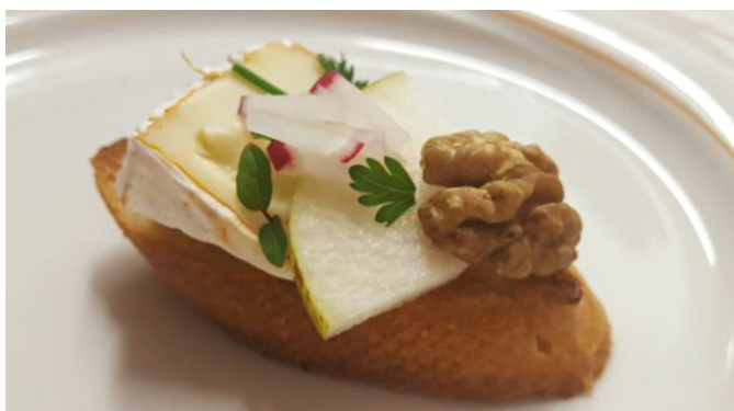
Opečen kruhek, paradižnikove kocke, sir brie, rezina hruške, orehovo jedrce, redkvice, zelišča

Priprava: Francosko štruco narežemo na kolobarje in na maslu opečemo. Tako pripravljene kruhke poljubno okrasimo.