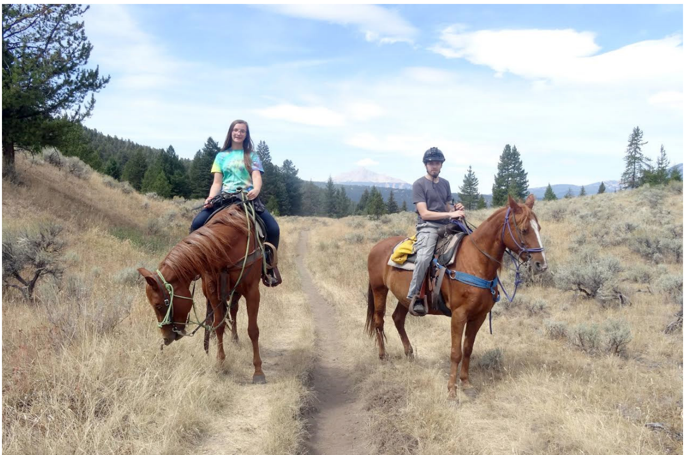
Jahanje v Montani.