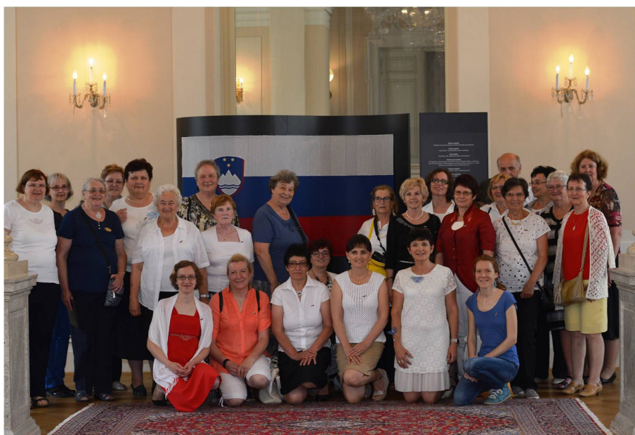
Klekljarice pred zastavo v predsedniški palači