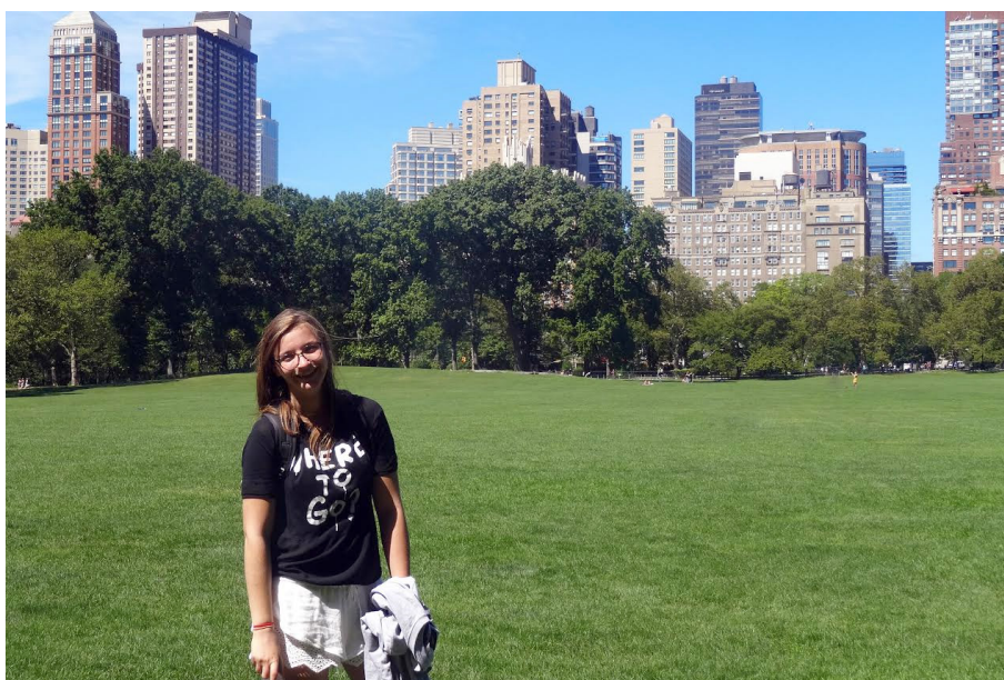
Central Park, NY.