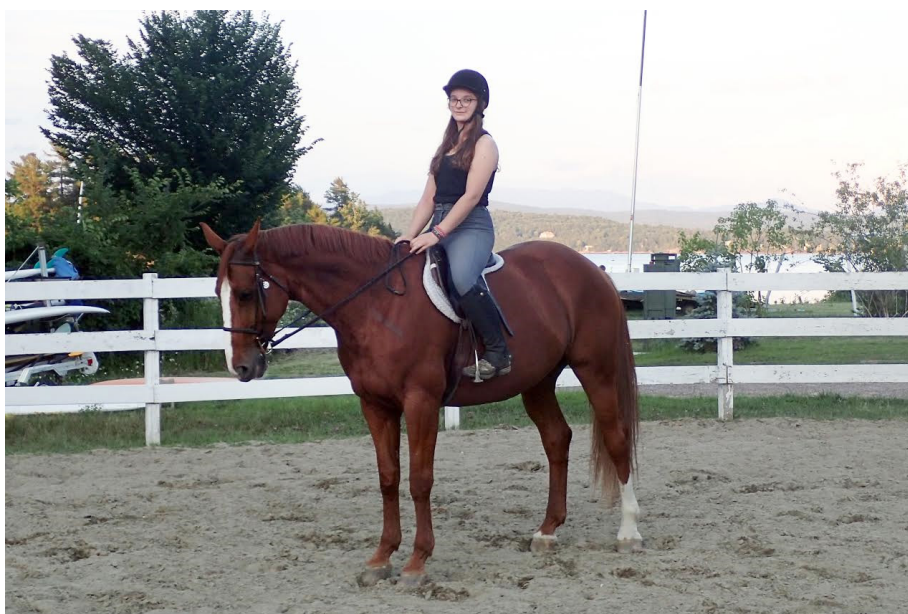
Na konju.